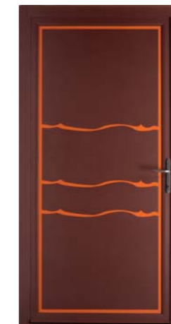
Ondines Torrent extérieur

Harmonisation totale avec les menuiseries MINCO®.