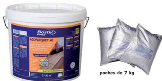
poches de 7 kg

Replanissage/vitrification après 2 à 3 jours.