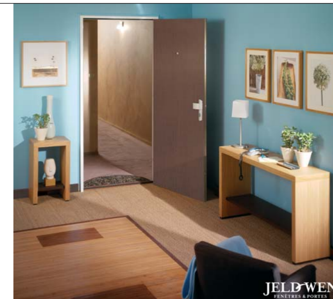
JELD-WEN FENÊTRES & PORTES