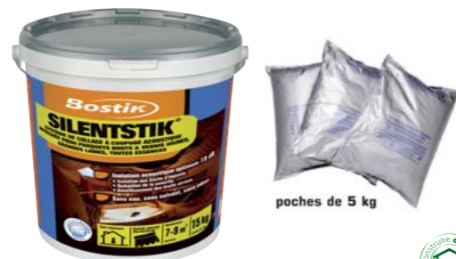
poches de 5 kg

une vraie innovation au service du parqueteur