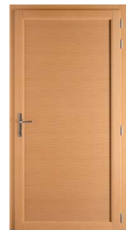
Ondines Méandre intérieur