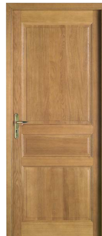
Chêne sélectionné chêne clair