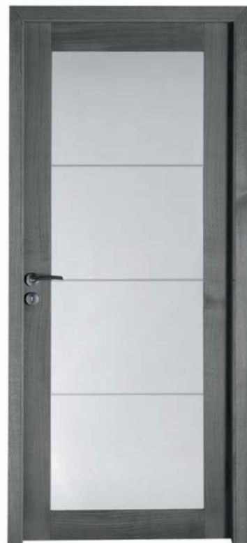
Bora chêne ardoise brossé