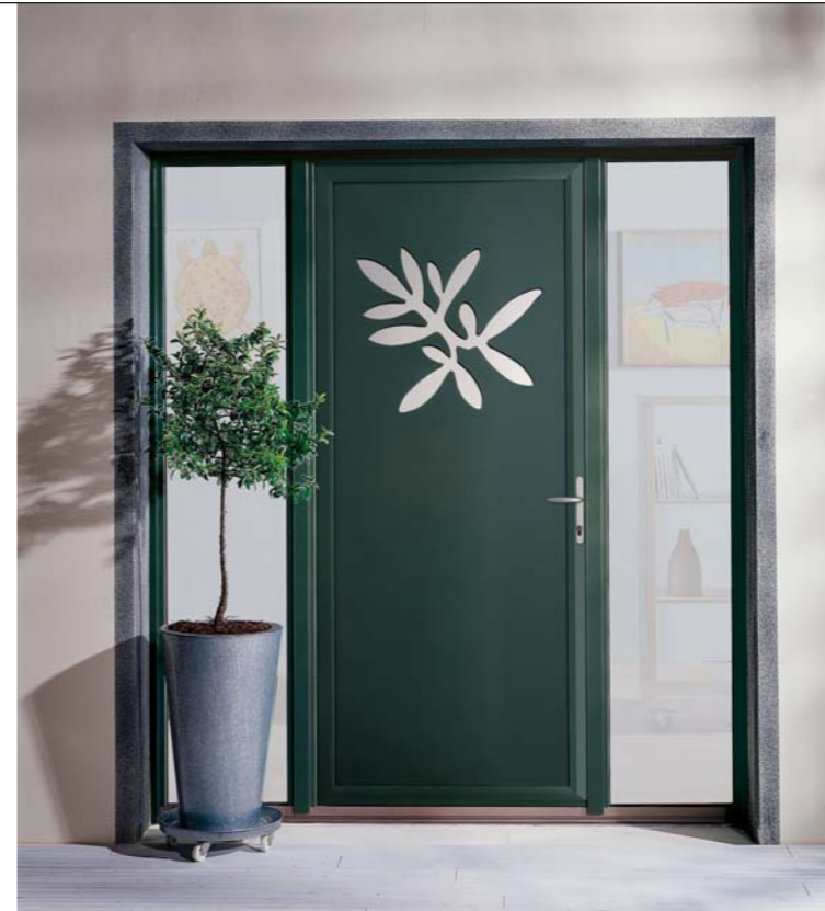
Végétales Hellébore extérieur