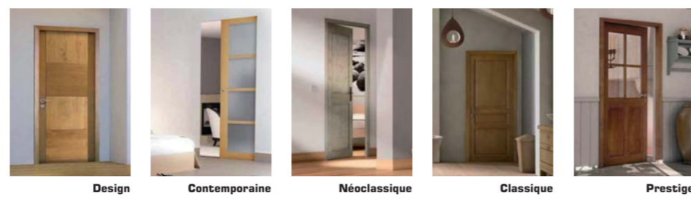
Design Contemporaine Néoclassique Classique Prestige

Du choix pour rêver, confort et sérénité, savoir-faire et qualité.